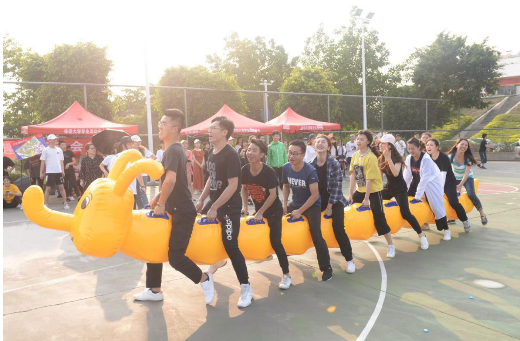
（音乐舞蹈学院趣味运动会）