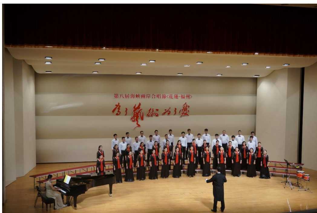
合唱团荣获第八届海峡两岸合唱节（台湾花莲）银奖