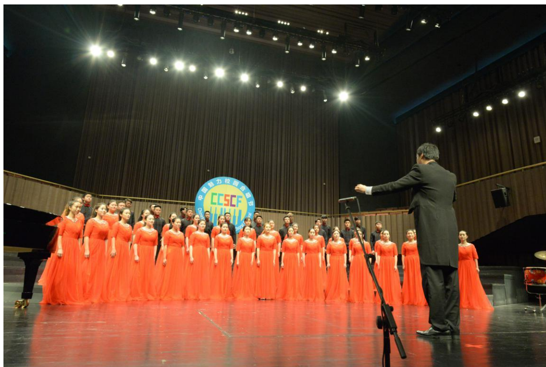
合唱团荣获第八届中国魅力校园合唱节（杭州）荣获一等奖