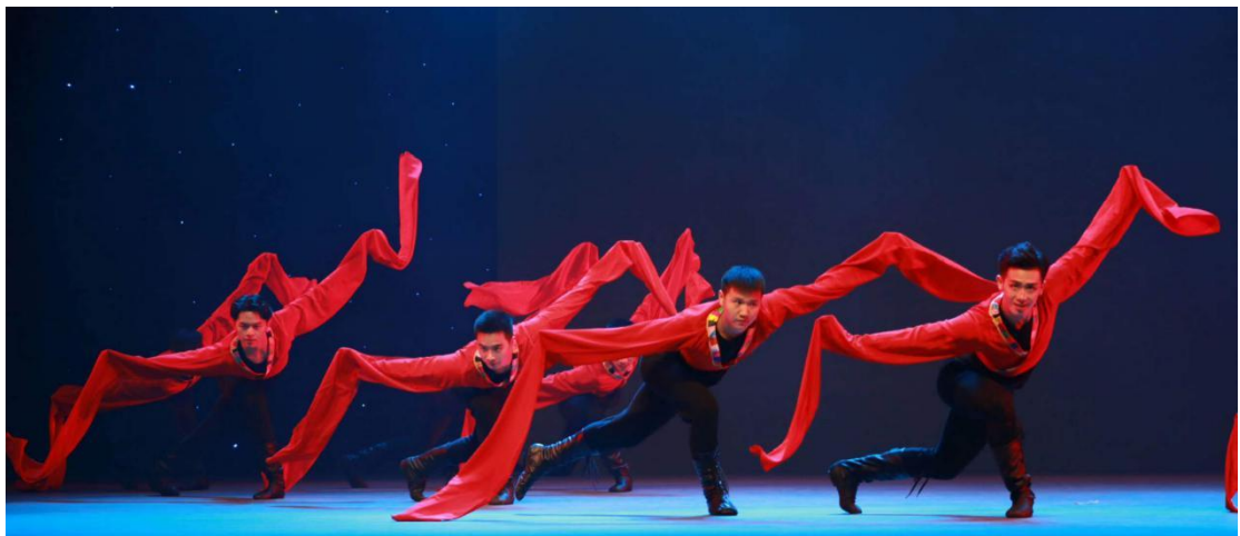
华园艺苑演出剧照

学院目前有合唱团、民乐团、舞蹈团三个学生团体，代表校园里最高专业水平的学生团队，常年代表学校外出演出和比赛，取得不斐