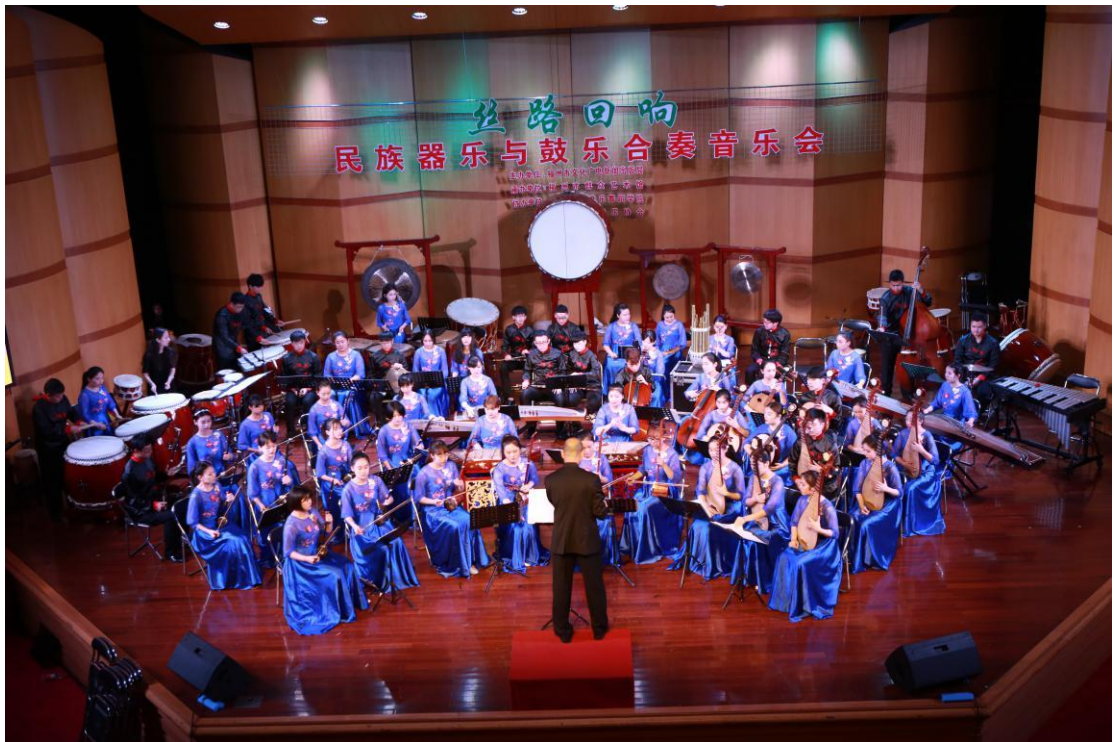
民乐团应邀赴福州九日台音乐厅举行专场演出