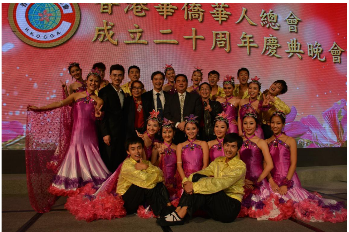
舞蹈团应邀赴香港演出