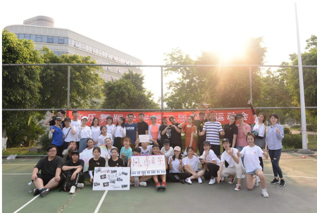
（音乐舞蹈学院第二届趣味运动会）