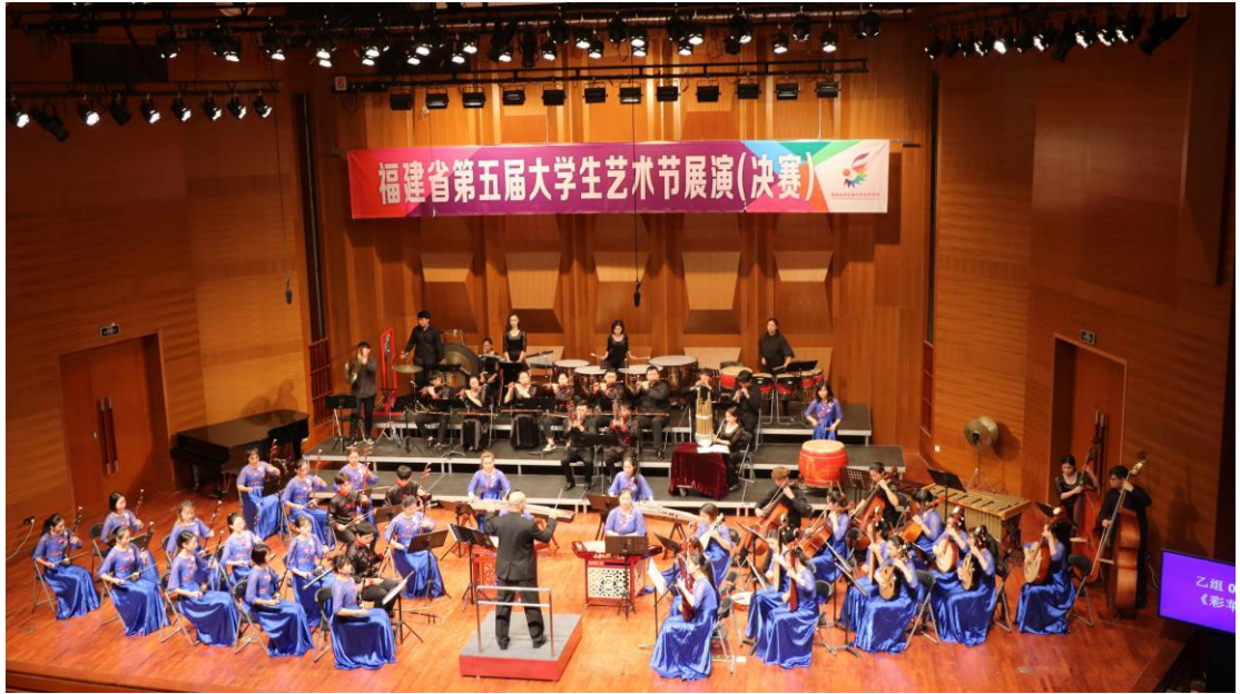
民乐团荣获福建省第五届大艺术节一等奖（器乐组）