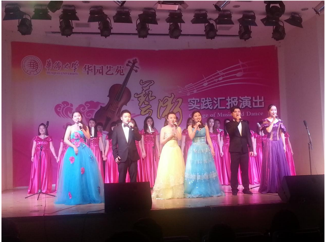
华园艺苑演出剧照