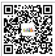
首都师范大学学生会