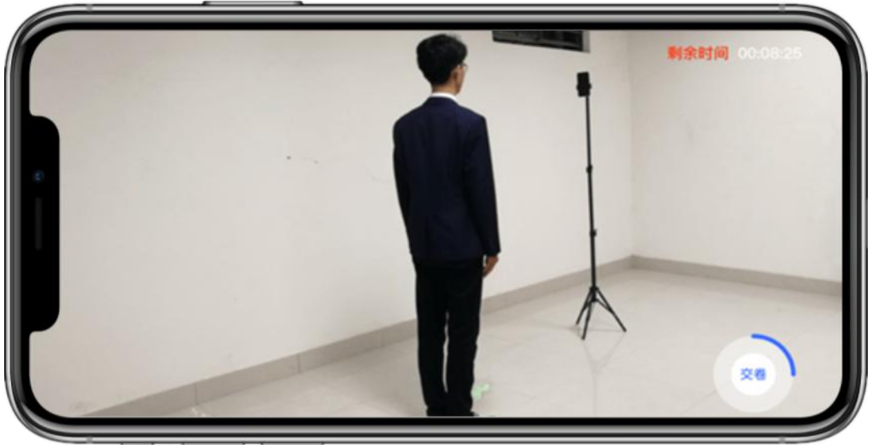
(辅机视频录制画面)

考生拍摄视频，拍摄时长结束后，会自动停止拍摄，或者考生可以手动停止拍摄。视频停止后，拍摄的视频将会自动保存。