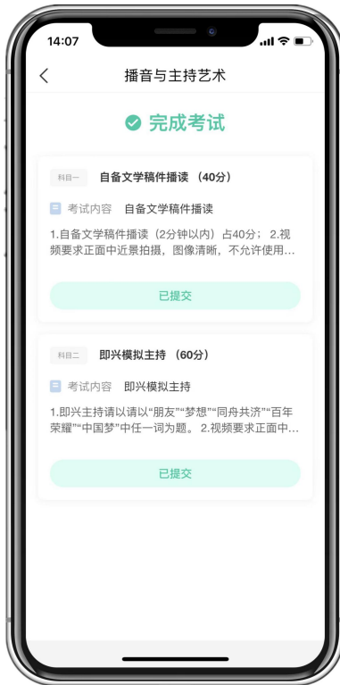
(所有科目完成考试)