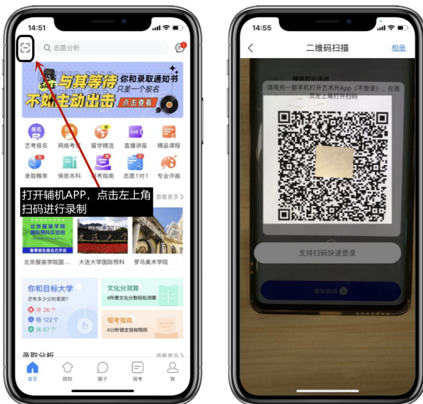
(打开辅机进行扫码)