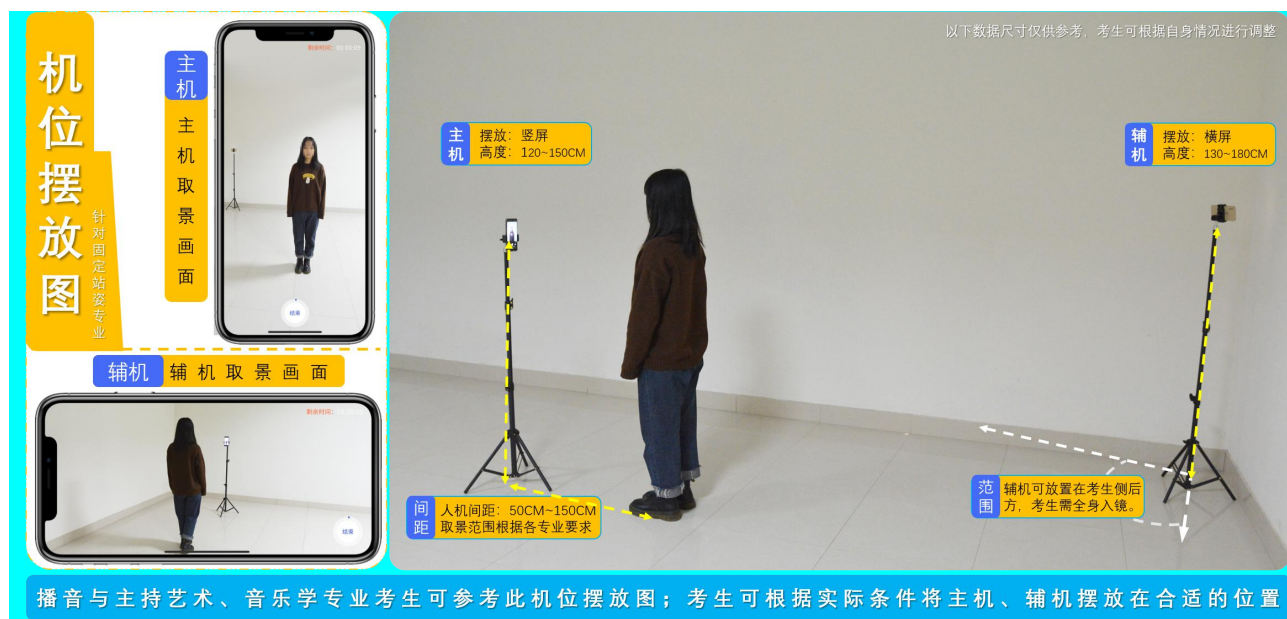
（音乐学、播音与主持艺术拍摄机位图）

考生进入“网络考试”菜单后可选择进行考前练习，没有参加考前练习的考生将无法进行正式考试。考生可以通过多次考前练习，熟练掌握考试流程，确定好拍摄的最佳距离、角度和位置。