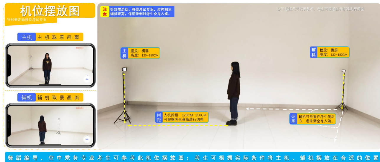
（舞蹈编导、空中乘务拍摄机位图）