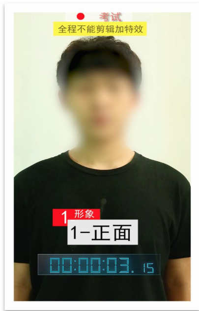
图 1：仪容形体（仪容展示）构图